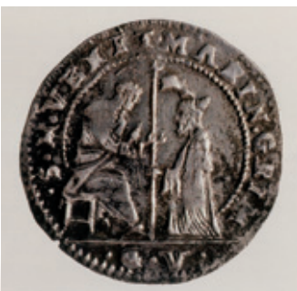
Marino Grimani, 1595-1605, argent. Le Doge agenouillé devant Saint Marc.

Architecture navale / embarcations traditionnel