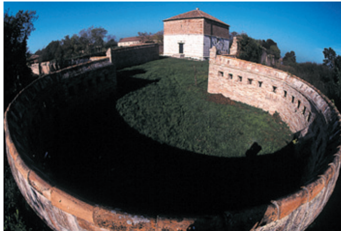
L'enceinte et la poudrière (XVI ème ) à l'angle sud-est.

Durant la domination napoléonienne, puis autrichienne, elle fut utilisée à des fins militaires et commença à participer au système de défense de la lagune: les grandes arcades du Teson furent bouchées pour transformer l'édifice en poudrière et le mur d'enceinte fut équipé de meurtrières, de corps de garde, de grands bastions en pierre d'Istrie et de terre-pleins à l'extérieur. L'île fut reliée à la tête de pont de Saint Erasme et à la batterie de la Tour Maximilien qui contrôlait l'entrée du port du Lido.