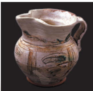
Petit pichet (pot) en céramique bosselé et incisé (XVII ème )