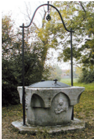
Margelle de puits (sec. XVI)